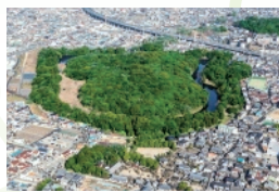
7・8 月 応神天皇陵古墳