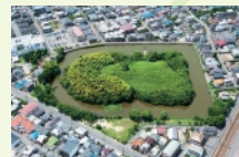
5 月 いたすけ古墳