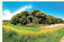
4 月 允恭天皇陵古墳