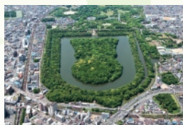
1・2 月 仁徳天皇陵古墳