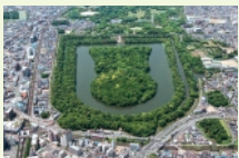
1 月 仁徳天皇陵古墳

ケースにスミ 1 色で名入れ印刷いたします。 (名入れ印刷スペース：縦 11×横 170 mm)