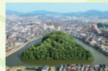
6 月 白鳥陵古墳