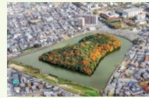
11 月 ニサンザイ古墳