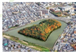
9・10 月 ニサンザイ古墳