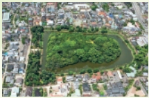
7 月 反正天皇陵古墳