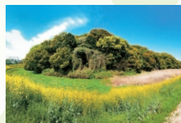
3・4 月 允恭天皇陵古墳