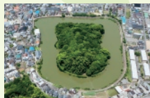
3 月 御廟山古墳