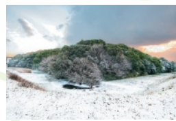
11・12 月 仲姫命陵古墳