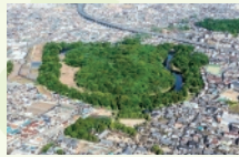
8 月 応神天皇陵古墳