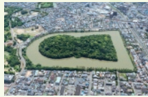
9 月 履中天皇陵古墳