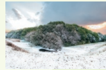
12 月 仲姫命陵古墳