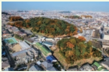
10 月 墓山古墳(中央) 向墓山古墳(手前)