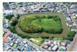
5・6 月 いたすけ古墳