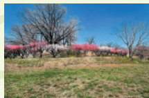
2 月 古室山古墳